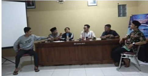
Gambar 2. Pelaksanaan Observasi dan Identifikasi dengan Pengurus Karang Taruna Tunas Muda

organisasi tercukupi untuk melaksanakan program kerja. Sokongan dana merupakan penghambat dalam mengembangkan kreativitas upaya untuk mengefektifkan kegiatan dalam organisasi Karang Taruna (Kurniasari et al., 2013). Kedua program tersebut tidak ada satupun administrasi yang menunjukkan adanya program kerja sudah diselesaikan.