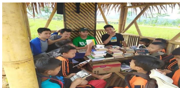
Gambar 4. Proses Pendampingan pada program kerja Taman Baca

Proses pendampingan yang kedua tentang pembuatan laporan kegiatan untuk memberikan wawasan tentang bagaimana menyusun laporan kegiatan yang baik. Pendampingan kedua dilaksanakan pada tanggal 11 Januari 2020. Pada kesempatan ini peserta membuat laporan program kerja yang sudah dilaksanakan untuk dokumentasi dan administrasi. Peserta membuat laporan program kerja tentang pembuatan lapangan bola voli yang sudah dilaksanakan dan kegiatan pengumpulan buku bacaan.