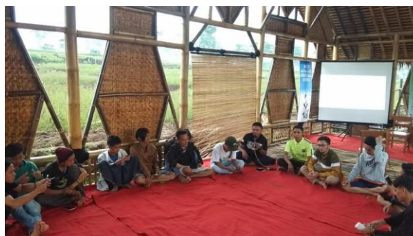
Gambar 3. Proses Pelatihan

Untuk pelatihan yang kedua dilakukan pada tanggal 22 Desember 2020 membahas tentang “Proses Perencanaan, Pelaksanaan, dan Evaluasi Program Kerja”. Kegiatan pada pelatihan kedua juga dihadiri oleh sekitar 20 pemuda dari keanggotaan karang taruna. Kegiatan ini guna memberikan wawasan dalam menjalankan roda organisasi terutama menjalankan program-program kegiatan yang akan dilaksanakan. Respon peserta terkait pelatihan yang diberikan sangat baik dibuktikan dari hasil diskusi terkait adanya pelaksanaan pengabdian ini bahwa pemuda Karang Taruna terbantuan terutama dari proses pengembangan keilmuan tentang Karang Taruna dan membuat pemuda memiliki semangat dalam membangun Karang Taruna Tunas Muda menjadi lebih baik.