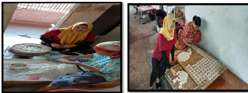
Gambar 1 : pendampingan pembuatan kerupuk ikan

Penyuluhan atau penyampaian teori, transfer ilmu pengetahuan tentang pengolahan ikan tongkol menjadi kerupuk ikan juga dilakukan dengan pendampingan atau praktik langsung membuat kerupuk. Kegiatan ini bertujuan untuk meningkatkan pengetahuan peserta melalui keterlibatan langsung dalam proses pembuatan krupuk ikan tongkol. Sehingga diharapkan setelah kegiatan ini selesai, masyarakat dapat secara mandiri untuk melanjutkannya sebagai kegiatan usaha yang dapat memberikan penghasilan tambahan.