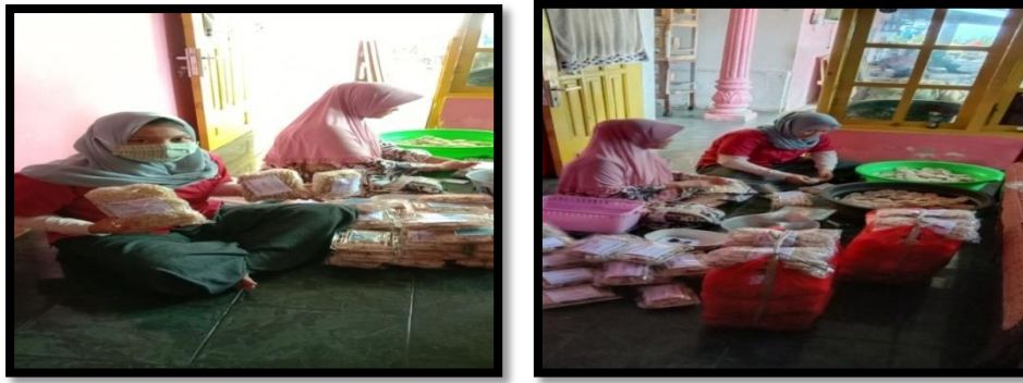
Gambar 2: proses pendampingan pengemasan dan pemasangan label produk

Kegiatan pelatihan penjualan online di berikan dengan melakukan pengadaan label nama produk sebagai branding produk sehingga UKM mampu menjual produknya melalui online. Penggunaan pemasaran online juga suatu cara yang menghemat biaya sehingga lebih efisien dan efektif. Pelatihan telah diberikan tentang Pemasaran online, selain itu juga dibantu untuk mendaftarkan pemasaran produk di market place, yaitu di Tokopedia dan Shopee juga melalui media sosial facebook, intagram, twitter dll. Pendampingan dalam memasarkan Kerupuk secara online terhadap UKM, dan Kerupuk yang dijual ini kita namakan Kerupuk Aneka hasil laut Kerupuk agar dapat dijual secara mandiri dan hasilnya dapat dimanfaatkan untuk peningkatan taraf hidup mitra.