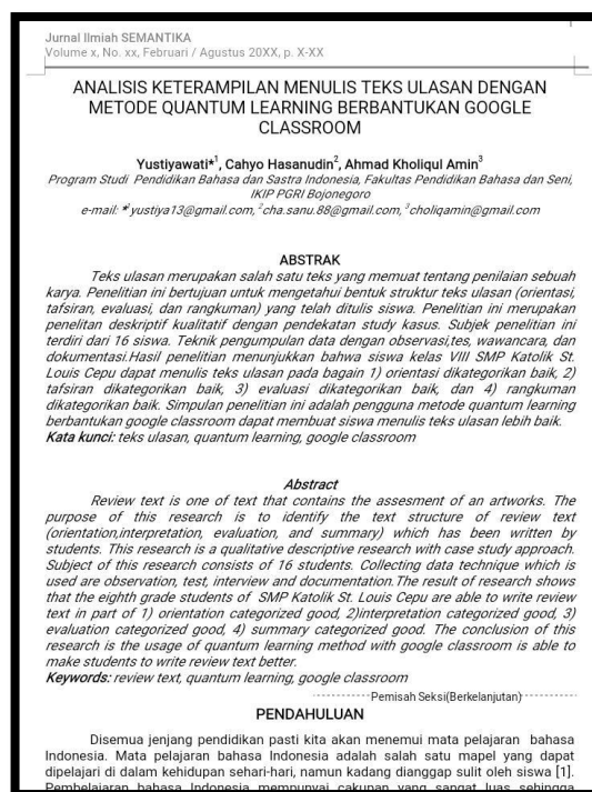
Gambar 2. artikel ilmiah mahasiswa tingkat akhir

Setelah mengikuti pelatihan sesi pertama, tim pengabdian melakukan wawancara untuk mengetahui tingkat keberhasilan pengabdian pada sesi pertama. Berdasarkan hasil wawancara via whatsapp, mahasiswa tingkat akhir menjelaskan bahwa pelatihan ini sangat penting dalam menambah pengetahuan mahasiswa. Hal ini dapat dilihat dari gambar berikut.