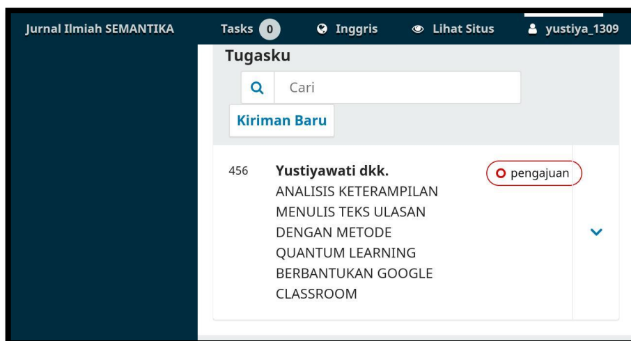
Gambar 4. artikel yang disubmite pada jurnal nasional terakreditasi Sinta

Pada akhir sesi du aini, tim pengabdian bersama mahasiswa tingkat akhir merefleksikan kekurangan dan kendala yang dihadapi oleh mahasiswa tingkat akhir selama proses pengabdian. Mahasiswa tingkat akhir memberikan pesan dan kesan seperti berikut.