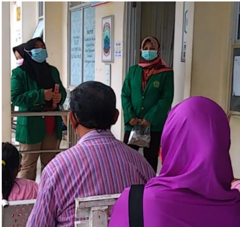
Gambar 3 Penyuluhan DBD di Ruang Tunggu Luar Gedung UPT Puskesmas Way Urang