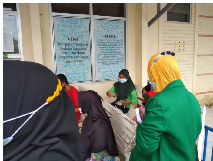
Gambar 4 Pembagian Leaflet DBD dan Abate