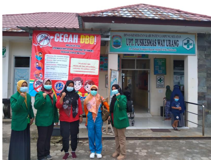
Gambar 5 Pemasangan Banner Pencegahan DBD melalui PSN