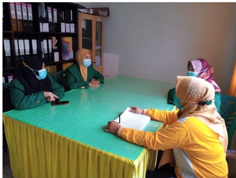
Gambar 2 Wawancara bersama pengelola program DBD UPT Puskesmas Way Urang

Berdasarkan hasil penentuan prioritas alternatif pemecahan masalah yang diimplementasikan yakni penyuluhan DBD. Rencana awal dalam melakukan implementasi berupa kegiatan penyuluhan mobile keliling menggunakan kendaraan Pusling beserta pembagian abate dibatalkan terkait perubahan zona pandemi Covid-19 mulai tanggal 11 Januari menjadi zona merah. Sehingga implementasi yang dapat dilaksanakan yakni penyuluhan di luar gedung pasien rawat jalan di UPT Puskesmas Way Urang yang dihadiri 11 orang pasien dimana penyuluhan yang dilakukan dengan metode ceramah dan tanya jawab menggunakan alat peraga leaflet tentang pencegahan penyakit DBD dengan 3 M Plus. Setelah itu, dibagikan abate dan dijelaskan aturan cara pemakaiannya, pemasangan banner dan gerakan serentak pemutaran video pencegahan penyakit DBD melalui media elektronik.