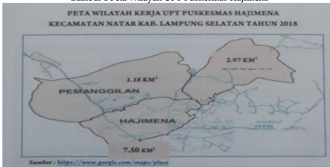
Gambar 1 Peta Wilayah UPT Puskesmas Hajimena

Jumlah penduduk UPT Puskesmas Hajimena pada tahun 2019 seluruhnya 32.786 jiwa, jumlah penduduk laki-laki 16.594 dan jumlah penduduk perempuan 16.192