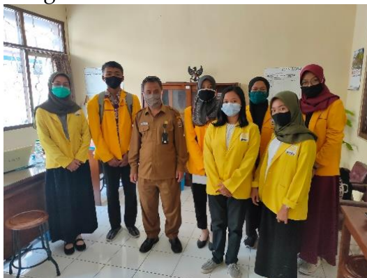
Gambar 3. Kegiatan Lapor Diri

dengan senang hati adanya kegiatan KMP di Kabupaten Temanggung ini. Selain itu pihak Disdikbud juga memberikan arahan serta penjelasan terkait sistem pendidikan di Kabupaten Temanggung yang mengalami perubahan semenjak penyebaran Covid – 19 semakin meluas. Penjelasan dan arahan tersebut digunakan sebagai acuan dalam merencanakan, dan juga melaksanakan program – program kerja dari KMP di SD yang menjadi sasaran kegiatan.