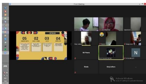
Gambar 6. Mengajar Daring

Kegiatan mengajar yang dilakukan ini terfokus kepada pembelajaran literasi dan numerasi yang berkaitan dengan bahasa Indonesia dan matematika. Dilihat dari jumlahnya, tingkat keaktifan siswa kelas 2A dan 2B dalam kedua mata pelajaran tersebut lebih meningkat utamanya ketika pembelajaran luring yang dilaksanakan selama 3 minggu. Selain itu, beberapa siswa yang diawal program masih mengalami kesulitan dalam hal membaca, menulis, dan berhitung mengalami peningkatan kelancaran dalam ketiga hal tersebut.