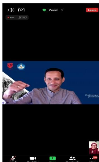
Gambar 2. Kegiatan Pembekalan oleh Kemendikbud

Kegiatan Kampus Mengajar Perintis atau KMP di SD Negeri 2 Jampiroso berlangsung selama 2,5 bulan mulai dari Oktober 2020 hingga Desember 2020. Pelaksanaan program KMP oleh mahasiswa diawali dengan mengikuti pembekalan yang diselenggarakan oleh Kemendikbud RI selama 5 hari berturut – turut dengan tujuan sebagai persiapan awal bagi para peserta sebelum terjun langsung dalam pelaksanaan kegiatan.