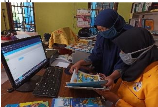
Gambar 8. Kegiatan administrasi perpustakaan

Kegiatan bantuan administrasi dilaksanakan baik untuk guru maupun SD N 2 Jampiroso itu sendiri. Di tingkat sekolah bantuan administrasi yang dilaksanakan dilakukan untuk administrasi perpustakaan dan juga administrasi UKS, seperti pendataan dan inventaris buku, inventaris obat – obatan, pendataan kelengkapan alat – alat UKS dan sebagainya. Selain perpustakaan dan UKS, kegiatan bantuan administrasi juga dilakukan dalam pelaksanaan rapat – rapat dan juga administrasi pengontrolan suhu terhadap setiap orang yang keluar masuk lingkungan sekolah.