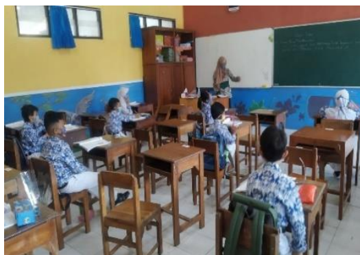
Gambar 5. Mengajar Luring