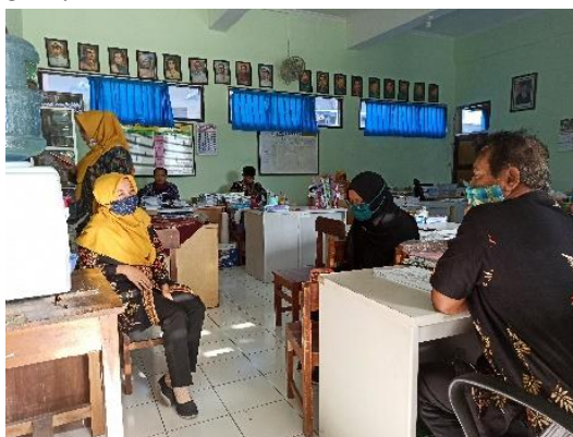
Gambar 4. Kegiatan Observasi, wawancara, dan diskusi

Observasi, merupakan kegiatan lanjutan yang dilakukan setelah melaksanakan lapor diri. Menurut Syamsudin, Amir (2014q), observasi merupakan suatu upaya mengambil atau mengumpulkan informasi dengan melakukan pengamatan langsung di lapangan. Sejalan dengan pengertian tersebut tujuan dilakukannya observasi ini adalah untuk mengetahui berbagai hal yang menjadi hambatan baik dari pihak sekolah, guru, maupun siswa selama melaksanakan pembelajaran di masa pandemi. Selain melaksanakan kegiatan observasi, dalam mengumpulkan data tersebut, juga didukung dengan melakukan wawancara serta diskusi bersama guru kelas 2A dan 2B. Kegiatan ini dilakukan diminggu pertama dengan mengulik informasi terkait beberapa hal penting yang menjadi acuan utama dilaksanakannya kegiatan KMP. Informasi – informasi tersebut terdiri dari beberapa hal utama antara lain: 1) Kegiatan Belajar Mengajar (KBM), 2) Kemampuan menggunakan teknologi penunjang KBM, serta 3) Kegiatan administrasi sekolah dan guru selama masa pandemi.