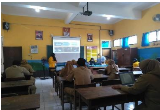
Gambar 7. Sosialisasi dan adaptasi teknologi

Kegiatan sosialisasi dan adaptasi teknologi yang dilakukan mendapatkan tanggapan yang sangat positif dari semua pihak guru yang mengikuti kegiatan tersebut. Selain melaksanakan sosialisasi dan adaptasi teknologi, pelatihan dan pendampingan kepada guru yang masih belum bisa menggunakan teknologi dengan baik juga tetap berjalan. Hasilnya terhitung dari sekitar 13 guru yang masih awam terhadap teknologi sebagian besar dapat menerapkan teknologi yang telah disosialisasikan dalam proses pembelajaran dengan baik, mulai dari melakukan PAS (Penilaian Akhir Semester) secara online melalui google form , menggunakan aplikasi zoom , dan sebagainya.