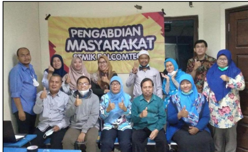
Gambar 5. Foto Bersama Setelah Selesai Kegiatan

Setelah selesai kegiatan praktek submit artikel dan tanya jawab, kegiatan pengabdian dalam bentuk tatap muka selesai dan akan dilanjutkan secara online. Pada akhir kegiatan dilakukan penutupan serta foto bersama.