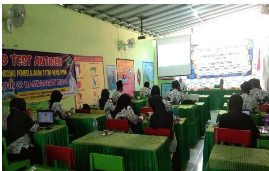
Gambar 2. Penyampaian materi PTK

Tahapan kedua adalah penyampaian materi PTK oleh pemateri. Materi yang disampaikan adalah tentang pentingnya melakukan penelitian tindakan kelas di masa pandemi. Pelatihan ini diharapkan guru dapat mengetahui manfaat dan bagaimana pelaksanaan PTK selama pembelajaran daring berlangsung. Kegiatan ini dilakukan dengan diskusi dan tanya jawab secara interaktif. Guru banyak bertanya tentang penerapan PTK secara kontekstual yang dapat dilakukan secara mandiri. Selain itu guru juga bertanya tentang pemaknaan dari PTK dalam kaitannya dengan kondisi pembelajaran jarak jauh. Pemateri memberikan pengetahuan tentang contoh-contoh riil yang dapat dilakukan. Selain itu tim juga menjelaskan makna PTK untuk meningkatkan prestasi belajar siswa selama pembelajaran jarak jauh berlangsung.