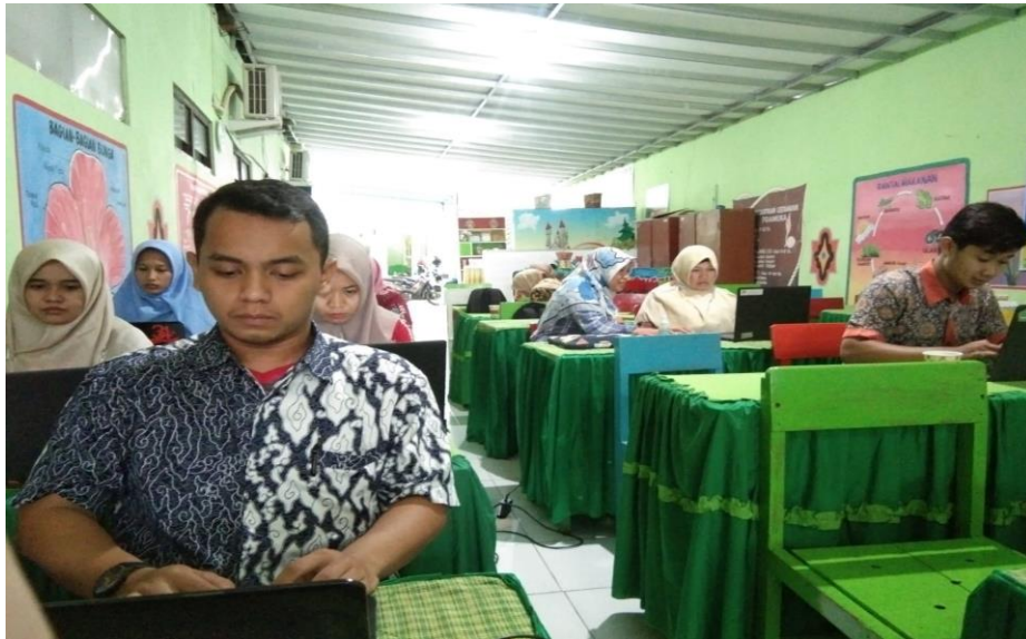
Gambar 3. Peserta pelatihan PTK