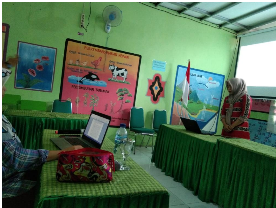
Gambar 4. Peserta melaksanakan seminar hasil

Tahapan terakhir dalam program ini adalah pelaksanaan seminar hasil. Seminar hasil menampilkan para peserta pelatihan untuk mempresentasikan hasil IHT pada program ini. Adapun hasil yang didapatkan yakni laporan akhir PTK dan artikel jurnal ilmiah berdasarkan laporan PTK.