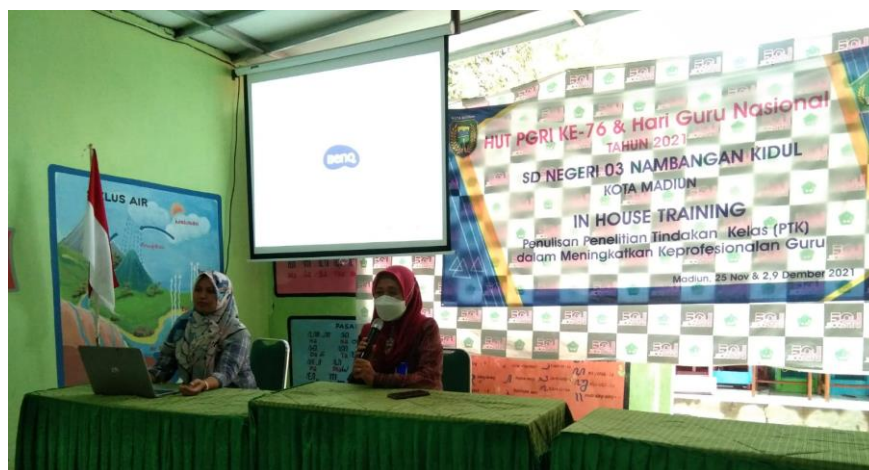
Gambar 1. Pembukaan dan sambutan

Tahap pertama yang dilakukan adalah melakukan pembukaan acara. Pada kegiatan ini disampaikan perkenalan, maksud, tujuan, kegiatan dan luaran yang akan dihasilkan. Acara ini juga disambut oleh kepala SDN 03 Nambangan Kidul Kota Madiun. Adanya dukungan dan motivasi kelembagaan sangat penting untuk penguatan kompetensi guru.