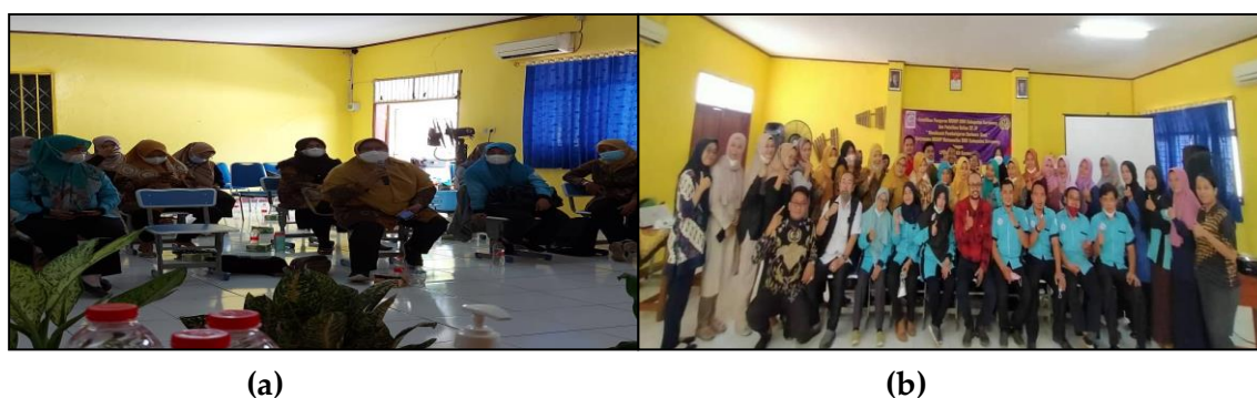
Gambar 2 Pemaparan Materi oleh Narasumber pertama yang dilakukan secara luring

Forum Group Discussion dan Workshop mendesain pembelajaran berbasis riset dilaksanakan pada Kamis dan Jumat, 25-26 November 2021. Pemaparan materi yang diberikan oleh masing-masing narasumber dilakukan secara hybrid (perpaduan antara daring dengan luring), pemaparan narasumber pertama dilakukan secara luring (luar jaringan) pada hari Kamis, 25 November 2021. Sedangkan pemaparan narasumber kedua dan ketiga dilakukan secara daring (berbantuan zoom-meeting ) pada hari Jumat, 26 November 2021. Adapun bukti pelaksanaan yang dilakukan secara luring disajikan pada Gambar 2.