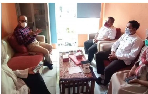
Gambar 1 Diskusi Terbatas dengan Perwakilan Pengurus MGMP Matematika SMK

Berdasarkan kesepakatan waktu dengan perwakilan pengurus MGMP Matematika SMK Kabupaten Karawang, dilakukan diskusi terbatas untuk memperoleh informasi yang lebih mendalam tentang pemahaman dan pengetahuan guru-guru matematika SMK di Kabupaten Karawang dalam merancang pembelajaran berbasis riset, ragam desain pembelajaran berbasis riset. Pelaksanaan diskusi dilaksanakan pada satu SMK Negeri di Kabupaten Karawang pada Tanggal 3 November 2021. Pelaksanaan diskusi tersebut dihadiri oleh empat perwakilan pengurus MGMP dari sekolah yang berbeda. Adapun bukti pelaksanaan diskusi disajikan pada Gambar 1.