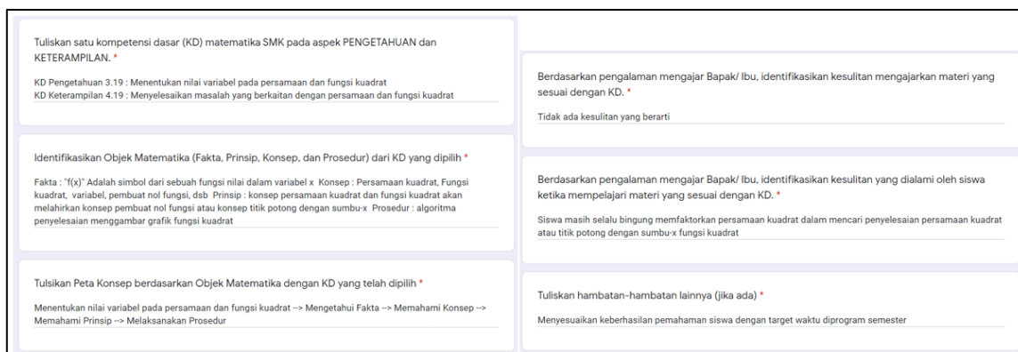
Gambar 3 Contoh Tugas (luaran) pertama workshop

Pada Gambar 3 merupakan contoh luaran hasil identifikasi salah satu peserta (Kode peserta, WEH) dalam mengidentifikasi analisis kurikulum, analisis hambatan didaktis, dan analisis hambatan epistemologis dari kompetensi dasar untuk diperoleh hipotesis lintasan belajar dan model epistemologis. Namun demikian, WEH belum mampu mengidentifikasi hipotesis lintasan belajar dan model epistemologis. Setelah pelaksanaan FGD, WEH mampu menyusun hipotesis lintasan belajar dan menyusun model epistemologis berdasarkan identifikasi kesulitan hambatan didaktis dan epistemologis.