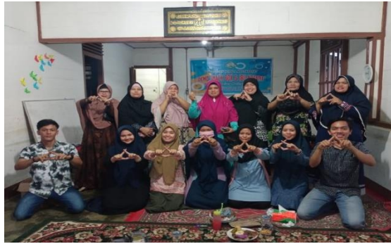
Gambar 3 : Kegiatan Ceramah

selain untuk memotivasi kaum ibu, pada kegiatan ini juga dijelaskan tentang alat dan bahan yang akan digunakan. Alat yang akan digunakan antara lain : kompor gas lengkap, blender, pisau, panci, cetakan puding dan alat kukusan. Bahan-bahan yang diperlukan antara lain :