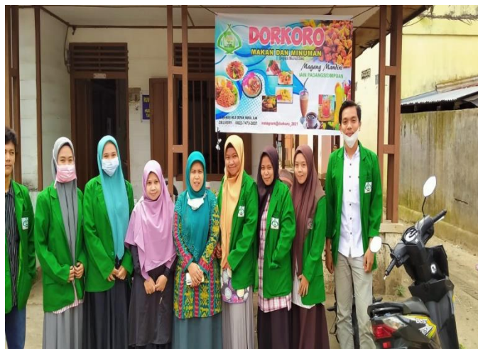
Gambar 2 : Lokasi Pengabdian Kepada Masyarakat

Kegiatan pengabdian dilakukan selama 3 hari yaitu tanggal 31 Maret-2 April 2021 mulai dari tahap persiapan sampai dengan tahap evaluasi. Lokasi atau tempat pengabdian kepada masyarakat berada di tempat yang strategis dan mudah dijangkau. Berikut adalah tempat lokasi pengabdian kepada masyarakat