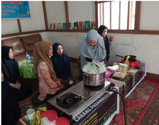
Gambar 4 : Alat dan Bahan