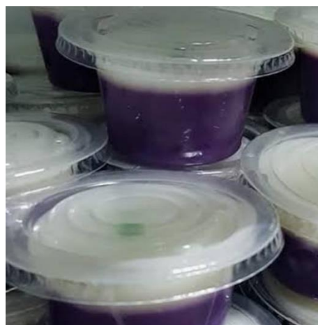
Gambar 6 : Hasil Olahan Puding Ubi Jalar Ungu

Pada langkah evaluasi, tim pengabdian kepada masyarakat juga melakukan penyajian produk berupa puding ubi jalar ungu. Penyajian produk dapat dilihat