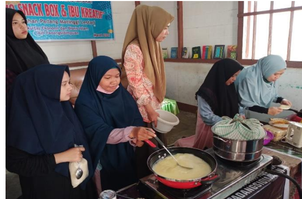
Gambar 5 : Mendemonstrasikan

Kegiatan mempraktekkan puding ubi jalar ungu dilakukan dengan langkah-langkah sebagai berikut :