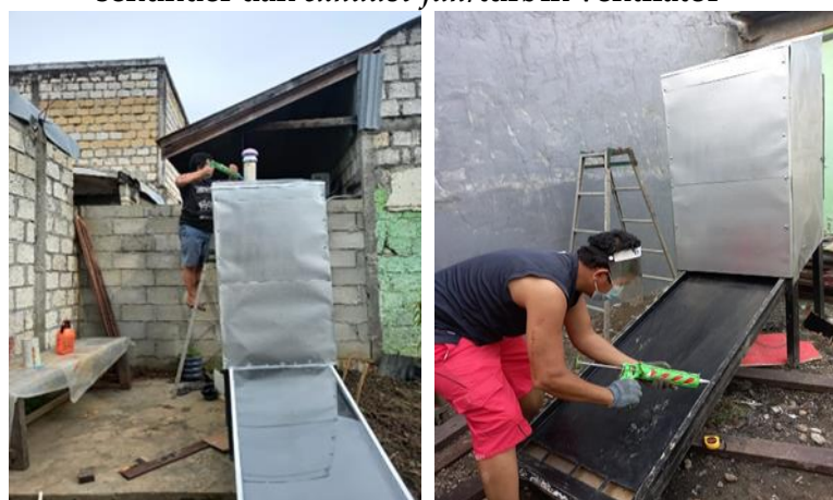
Gambar 2. Proses pabrikasi solar dryer dengan kolektor sekunder dan exhaust fan