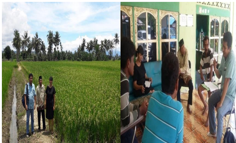
Gambar 3. Kunjungan lapangan dan sosialisasi solar dryer dengan kolektor sekunder dan exhaust fan