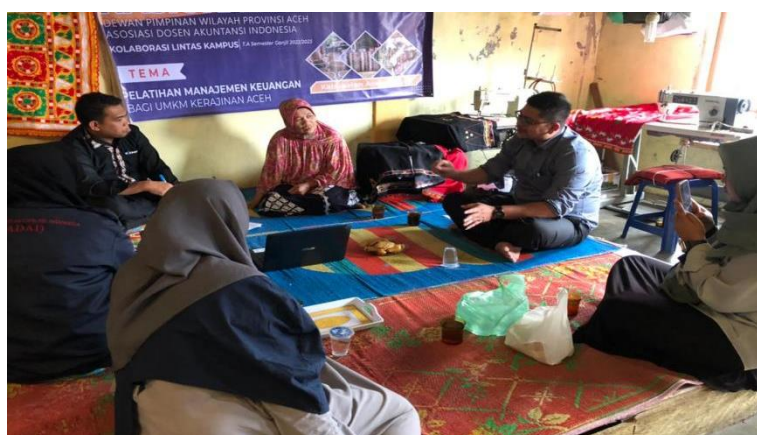
Gambar 2. FGD dengan Disah Kerawang