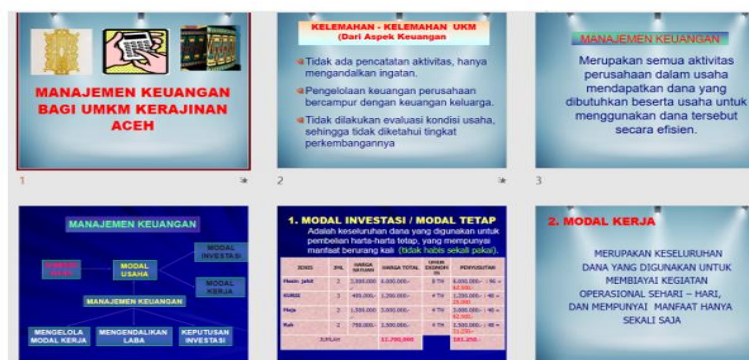
Gambar 4. Materi Pelatihan