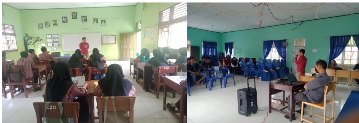
Gambar 4. Penyampaian materi kepada peserta didik MA dan SMK Tapaktuan

Oleh sebab itu dalam kesempatan ini, pemateri menyampaikan setidaknya ada 5 hal mendasar yang mesti dimiliki setiap peserta didik untuk membekali diri agar terhindar dari praktek-praktek korupsi dan sekaligus menanamkan budaya anti korupsi sejak dini. Kelima hal tersebut yaitu dengan cara menanamkan sifat jujur, bertanggung jawab, keteguhan hati, disiplin, kesederhanaan dan kerja keras.