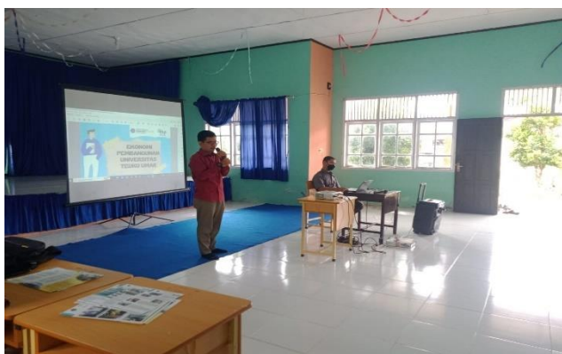
Gambar 5. Pemateri dan tim menjawab pertanyaan siswa saat sesi diskusi

Selesai menyampaikan materi pada sesi pertama, kegiatan dilanjutkan dengan pemutaran video mengenai contoh kasus korupsi yang ada di lingkungan sekitar dan diakhiri dengan sesi diskusi. Harapan dari pemutaran video ini adalah peserta didik menjadi semakin paham tentang praktek-praktek korupsi disamping itu juga dapat memberikan pengetahuan tentang bagaimana awalnya korupsi itu bisa terjadi. Pada menit-menit akhir video dipaparkan dampak sosial ekonomi yang disebabkan oleh korupsi. Korupsi menyebabkan masyarakat tidak bisa menikmati pembangunan yang dilakukan oleh pemerintah akibatnya masyarakat jauh dari kata sejahtera dan hal ini sangat bertentangan dengan cita-cita bangsa. Kesejahteraan merupakan kunci dari kemajuan suatu bangsa, ketika kesejahteraan masyarakat meningkat maka akan melahirkan sumber daya manusia yang berkualitas, dimana SDM ini nantinya akan menjadi penerus dalam memajukan bangsa pada segala bidang.