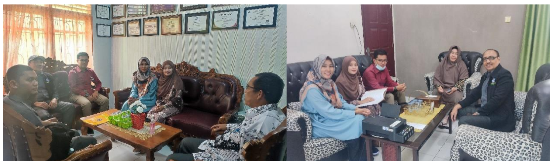
Gambar 3. Tim berkoordinasi dengan perwakilan MA dan SKM Tapaktuan untuk mendengarkan implementasi budaya anti korupsi di sekolah

Hasil pertemuan ini memberikan gambaran kepada tim bahwa pada dasarnya masing-masing sekolah yang dikunjungi telah menerapkan budaya anti korupsi melalui mata pelajaran PKn. Meskipun begitu pihak sekolah juga menginginkan adanya diskusi yang disampaikan oleh pihak luar dalam bentuk seminar mengenai contoh praktek korupsi. Mengingat setelah ini peserta didik akan melanjutkan studi ke jenjang yang lebih tinggi dan kondisi lingkungan yang dihadapi pun jauh lebih keras dibandingkan dengan sebelumnya. Oleh karena itu pihak sekolah berharap setelah nanti peserta didik menyelesaikan studi dari masing-masing sekolah, peserta didik bisa menjaga diri dengan tidak mencoreng nama baik sekolah sendiri sebagai seorang alumni.