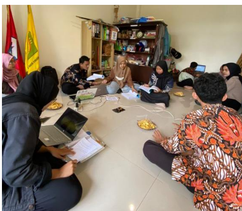
Gambar 3. Rapat Penyusunan Program di Setiap Dusunya

Terkait kebutuhan masyarakat di Desa Jetis dengan melihat permasalahan yang ada , masyarakat merasa anak-anak kurang memiliki wadah untuk mengembangkannya diri dan berkegiatan positif. Pentingnya mengembangkan potensi dari anak sehingga anak dapat berkembang sesuai dengan kemampuan dan minatnya (Sukatin et al., 2023). Selain itu, masyarakat prihatin dengan banyaknya kasus kekerasan seksual yang terjadi dimana-mana. Masyarakat takut jika kasus kekerasan seksual terjadi di lingkungannya sehingga perlu adanya edukasi terkait mitigasi kekerasan seksual sejak dini.