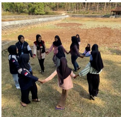
Gambar 9. Giat Bermain di Sanggar Nawasena

Giat bermain memiliki tujuan untuk memberikan wadah anak-anak untuk dapat mengisi waktu luang mereka dengan kegiatan positif. Permainan yang diberikan kepada anak-anak memiliki arti dalam edukasi mitigasi kekerasan seksual seperti permainan Lilintua (Lingkaran Lindungi Tubuh Aku). Giat bermain ini menjadi strategi tersendiri dari tim PPK-Ormawa untuk dapat memberikan edukasi kekerasan seksual sehingga anak-anak dapat senang mengikuti permainan dan teredukasi di dalamnya, sehingga bermain sambil belajar menjadikan pembelajaran efektif dan menyenangkan (Winatha & Setiawan, 2020).