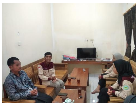
Gambar 1. Wawancara dengan tokoh masyarakat

untuk organisasi pemuda tidak semua dusun memiliki organisasi pemuda yang aktif berkegiatan di dusunya. Hanya ada kegiatan secara seremonial.