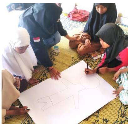
Gambar 10. Giat Berkarya di Sanggar Nawasena

Untuk menumbuhkan kreatifitas siswa, giat berkarya menjadi wadah anak untuk mengembangkannya. Dalam proses edukasi, tim PPK Ormawa bekerjasama dengan mitra strategis untuk dapat menunjang kegiatan edukasi. Dengan berkarya, anak dapat mengungkapkan ekspresi dalam dirinya serta mengembangkan kreativitas yang dimilikinya ( et al., 2021).