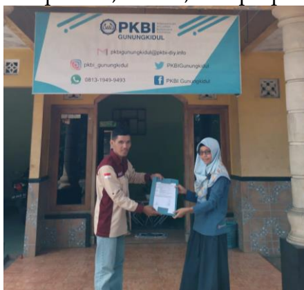
Gambar 5. Kerjasama dengan Mitra Strategis

Untuk melakukan kegiatan PPK Ormawa di Desa Jetis, terdapat beberapa tahapan. Tahapannya seperti adanya kerjasama dengan mitra, sosialisasi, pembuatan sanggar nawasena, edukasi mitigasi kekerasan seksual, pembinaan kelompok dan lokakarya. Untuk kerjasama yang dilakukan, tim PPK Ormawa melakukan koordinasi terkait kontribusi dari setiap mitra-mitra strategis yang dapat membantu berjalanya sanggar nawasena. Mitra desa yang dilibatkan adalah ibu kader, karang taruna, dan pihak desa sebagai mitra koordinasi kegiatan dan penerus dari keberlanjutan sanggar nawasena. Untuk mitra di luar desa adalah PKBI, Gunung Kidul Menginspirasi, Polsek Saptosari, UPPA, dan perpustakaan daerah.