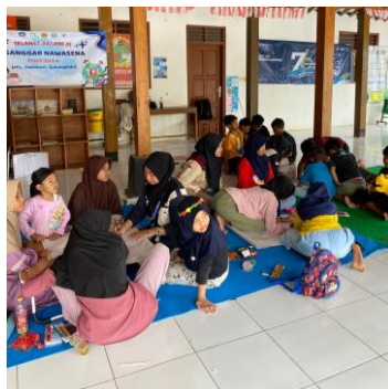
Gambar 8. Giat Berliterasi di Sanggar Nawasena

Giat bermain memiliki tujuan untuk memberikan wadah anak-anak untuk dapat mengisi waktu luang mereka dengan kegiatan positif. Permainan yang diberikan kepada anak-anak memiliki arti dalam edukasi mitigasi kekerasan seksual seperti permainan Lilintua (Lingkaran Lindungi Tubuh Aku). Giat bermain ini menjadi strategi tersendiri dari tim PPK-Ormawa untuk dapat memberikan edukasi kekerasan seksual sehingga anak-anak dapat senang mengikuti permainan dan teredukasi di dalamnya, sehingga bermain sambil belajar menjadikan pembelajaran efektif dan menyenangkan (Winatha & Setiawan, 2020).