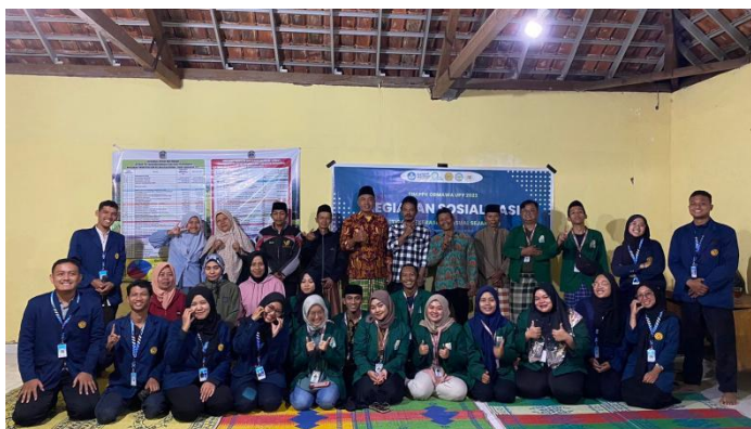
Gambar 6. Sosialisasi Program Sanggar Nawasena di Desa Jetis

Untuk menunjang kegiatan sanggar nawasena di setiap padukuhanya, tim PPK Ormawa melakukan pembuatan sanggar nawasena. Dalam pembuatannya, konsep dari bentuk sanggar dari setiap dusunya berbeda-beda disesuaikan dengan kondisi di setiap balai dusunya. Pembuatan sanggar nawasena ini dilaksanakan pada tanggal 6 Agustus hingga 13 Agustus 2023. Dalam pembuatannya, tim PPK Ormawa dibantu oleh masyarakat dusun sekitar.