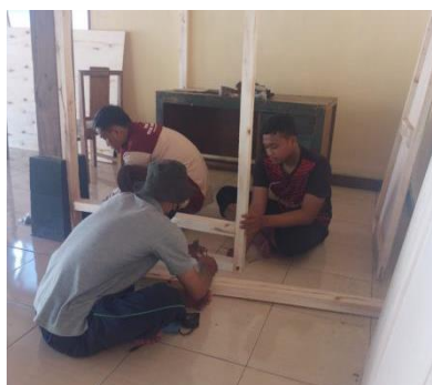
Gambar 7. Pembuatan Sanggar Nawasena di Balai Padukuhan

Untuk menunjang kegiatan sanggar nawasena di setiap padukuhanya, tim PPK Ormawa melakukan pembuatan sanggar nawasena. Dalam pembuatannya, konsep dari bentuk sanggar dari setiap dusunya berbeda-beda disesuaikan dengan kondisi di setiap balai dusunya. Pembuatan sanggar nawasena ini dilaksanakan pada tanggal 6 Agustus hingga 13 Agustus 2023. Dalam pembuatannya, tim PPK Ormawa dibantu oleh masyarakat dusun sekitar.