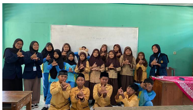
Gambar 2. Kunjungan ke SD di Desa Jetis

Setelah melakukan pengumpulan data, tim PPK Ormawa melakukan pemetaan kondisi dan masalah di setiap dusunya. Tim PPK Ormawa melakukan pemetaan di setiap dusun bukan dalam cakupan desa karena memang di setiap dusunya memiliki kendala, lingkungan dan potensi yang berbeda beda sehingga tim PPK Ormawa melakukan pemetaan pada setiap dusunya. Permasalahan anak-anak dan remaja di Desa Jetis sebagai berikut: