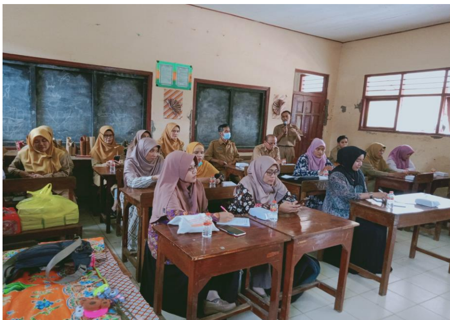
Gambar 3. Antusias Peserta Pelatihan

Selama mengikuti pelatihan selama dua hari, peserta sangat bersemangat dan antusias dalam menyimak materi yang disampaikan oleh narasumber. Setelah narasumber selesai menyampaikan materi, tim PKM dan peserta melaksanakan diskusi dan tanya jawab. Antusias peserta terlihat dari banyaknya pertanyaan yang diajukan dalam sesi diskusi