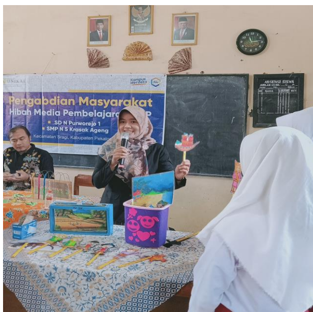
Gambar 2. Praktik Pembuatan Media “Wayang Karton”

Dalam pembelajaran bahasa Indonesia media “wayang karton” disajikan dengan membawakan cerita-cerita rakyat. Cerita rakyat dipilih karena cerita rakyat memiliki alur cerita yang menarik serta sarat akan nilai-nilai kebudayaan dan adat istiadat. Sifat kemenarikan dari cerita rakyat tidak hanya ditunjukkan oleh isi ceritanya saja, tetapi cara penuturannya yang dapat dipadukan dengan menggunakan media wayang yang sudah dikenal akrab di lingkungan kehidupan anak (Fujiastuti et al., 2019; Larasati, 2021). Cara ini dilakukan untuk mendekatkan peserta didik agar mencintai wayang sebagai salah satu hasil budaya bangsa.