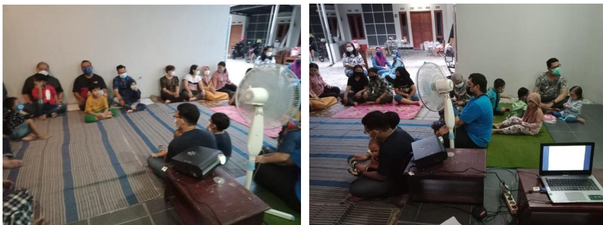
Gambar 1. Dokumentasi Kegiatan Pengabdian Masyarakat

tentang pentingnya germas sebagai salah satu solusi pencegahan penularan Covid 19. Setelah selesai pemutaran video dengan dan penyuluhan tentang Germas. Untuk mengukur keberhasilan pengabdian masyarakat sebelum acara selesai maka dilaksanakan post test. Acara selesai pukul 15.00 WIB.