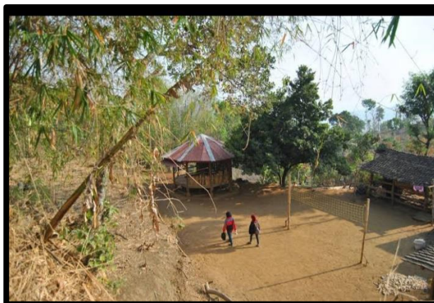
Gambar 1. Lokasi Kampung Wonopuro

Sasaran program pengabdian masyarakat ini adalah anak-anak Kampung Wonoporo Ponorogo. Program ini memberikan bantuan peningkatan literasi digital bagi anak-anak dalam menyeimbangi perkembangan teknologi dalam dunia pendidikan di daerah terpencil guna meningkatkan potensi serta prestasi. Jumlah anak-anak kampung Wonopuro terbilang 23 anak dengan rincian 10 siswa sedang mengenyam pendidikan ditingkat SMP, 8 siswa lainnya menempuh pendidikan Sekolah Dasar, serta 5 diantaranya tidak bersekolah. Tujuan literasi digital bagi anak-anak desa terisolir untuk mengedukasi masyarakat dalam memanfaatkan teknologi dan komunikasi dengan menggunakan teknologi digital dan alat-alat komunikasi atau jaringan untuk menemukan, mengevaluasi, menggunakan, mengelola, dan membuat informasi secara bijak dan kreatif. Program ini disuluhkan kepada anak-anak yang membutuhkan edukasi dan literasi guna meningkatkan keahlian dalam berteknologi.