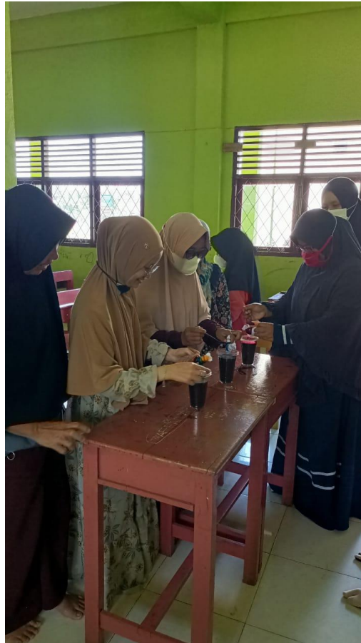
Gambar 3. Proses pewarnaan kain

Tahapan berikutnya setelah kain benar-benar kering adalah mencuci kain. Pada tahap ini ditujukan untuk menghilangkan residu pewarna remasol yang masih menempel dalam serat kain. Sehingga residu tersebut akan hilang dan memunculkan pewarna remasol yang sudah membentuk motif di kain. Perlu diingat bahwa pada saat pencucian kain, kain yang dicuci tidak boleh menggunakan sikat. Akan tetapi, proses pencucian tersebut dilakukan dengan cara dibasuh menggunakan air secara perlahan.