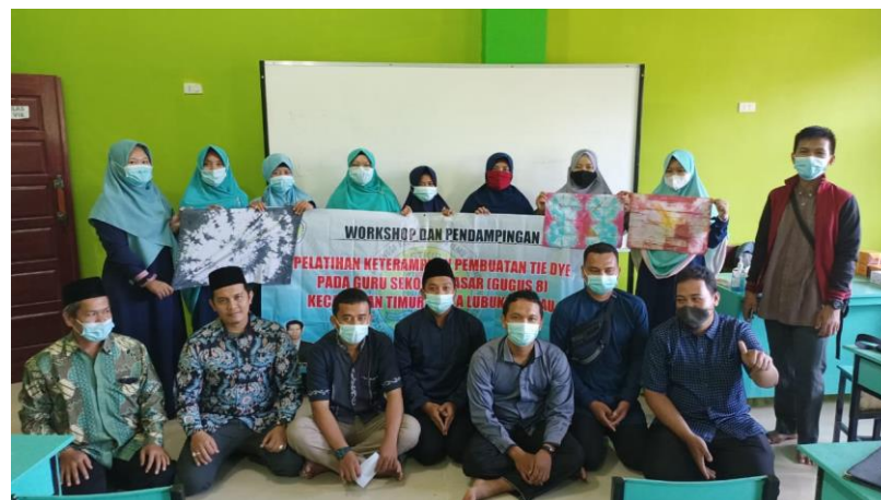
Gambar 4. Foto Bersama Setelah Kegiatan PPM

Tahapan berikutnya setelah kain benar-benar kering adalah mencuci kain. Pada tahap ini ditujukan untuk menghilangkan residu pewarna remasol yang masih menempel dalam serat kain. Sehingga residu tersebut akan hilang dan memunculkan pewarna remasol yang sudah membentuk motif di kain. Perlu diingat bahwa pada saat pencucian kain, kain yang dicuci tidak boleh menggunakan sikat. Akan tetapi, proses pencucian tersebut dilakukan dengan cara dibasuh menggunakan air secara perlahan.