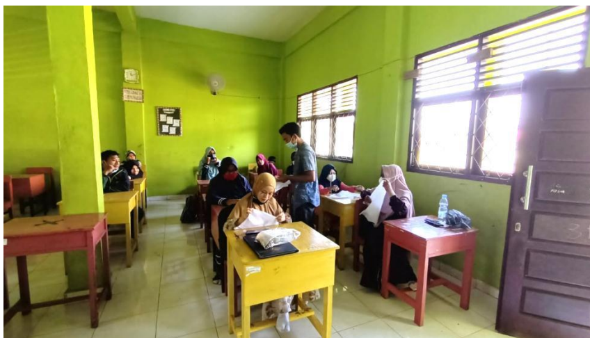
Gambar 1. Penyampaian materi oleh fasilitator

Penyampaian materi dilakukan diawal kegiatan guna menambah pengetahuan serta wawasan guru mengenai " Tie Dye ". Dalam hal ini, fasilitator memberikan pengetahuan mengenai " Tie Dye " baik berupa bahan dan alat yang digunakan serta teknik pembuatan. Proses penyampaian materi yang dilaksanakan seperti yang terlihat pada gambar 1.