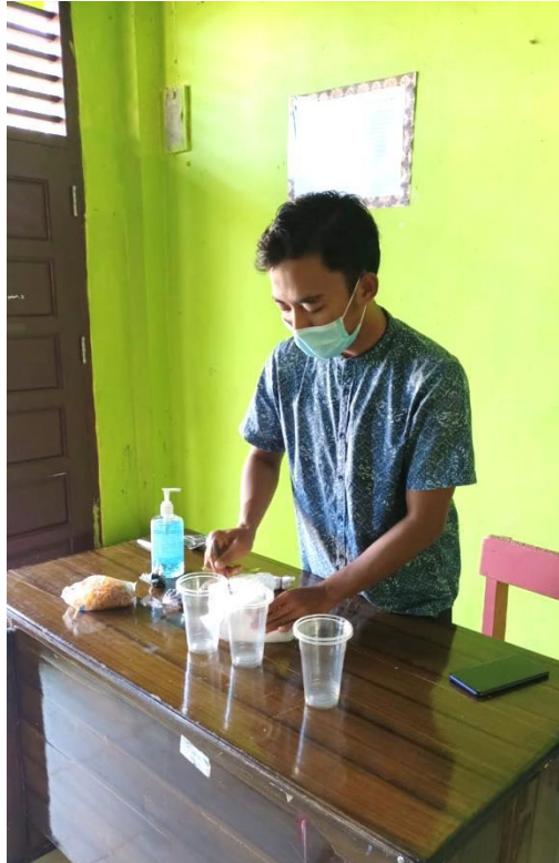
Gambar 2. Demonstrasi oleh fasilitator

Setelah masing-masing peserta menyimak demonstrasi yang dilakukan oleh narasumber, selanjutnya yaitu masing-masing dari peserta kegiatan menyiapkan bahan dan alat yang sudah disediakan oleh fasilitator. Kemudian, masing-masing dari peserta membuat pola (motif) pada kain dengan cara melipat kain. Pembuatan motif pada kain dilakukan dengan cara melipat kain sesuai dengan selera masing-masing peserta. Namun sebelumnya, fasilitator sudah memberikan beberapa contoh lipatan kain dengan menunjukkan hasil yang didapatkan dari lipatan tersebut. Sehingga peserta kegiatan dapat mengkombinasikan dari beberapa teknik lipatan yang dihasilkan nantinya. Setelah kain tersebut dilipat sesuai dengan keinginan, kemudian diikat menggunakan karet gelang. Hal ini guna memberikan garis pada motif kain yang dihasilkan.