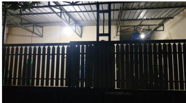
Gambar 3. Lokasi Pelaksanaan