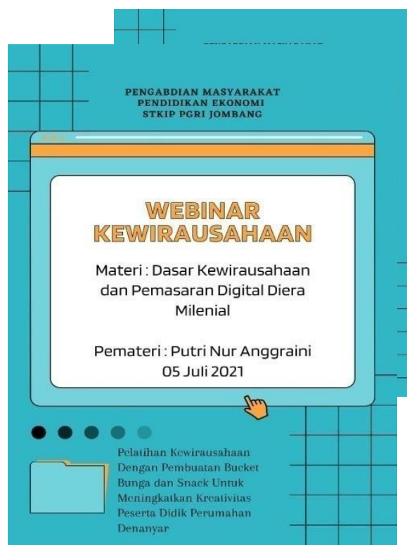
Gambar 1. Poster Kegiatan Webinar

Pengabdian Kegiatan ini dilaksanakan pada bulan Juni 2021 di Rumah Ibu Wiwik Wahyuni RT 09 RW 07 Perumahan Denanyar Indah. Jumlah peserta adalah 10 orang terdiri dari peserta didik tingkat SMA Sederajat. Kegiatan pertama yang dilaksanakan yaitu memberikan materi “Dasar kewirausahaan dan Pemasaran Digital Diera Milenial” oleh Saudari Putri Nur Anggraini pada 05 Juli 2021 secara online melalui media Zoom.