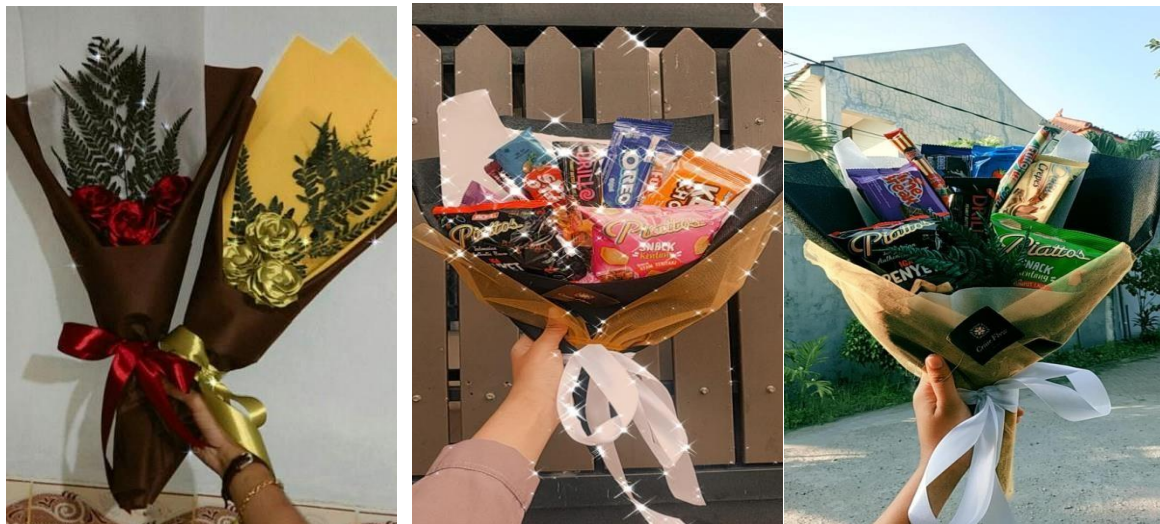
Gambar 5. Bucket Snack