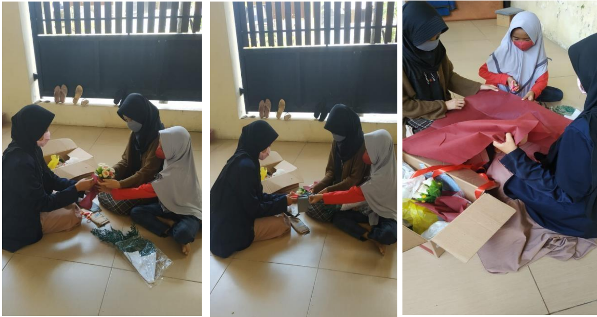
Gambar 4. Proses Pembuatan Bucket Bunga dan Snack