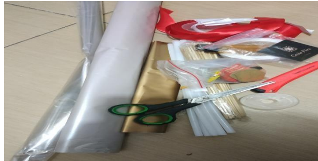
Gambar 2. Alat dan Bahan

sehingga kelopak bunga akan lebih bervolume dan lebih besar jika dilihat dari luarnya. Teknik pengerjaannya pun membutuhkan ketelitian dan kerapian sehingga mampu menghasilkan produk yang bernilai seni yang tinggi sehingga dapat diminati oleh banyak orang, khususnya kalangan remaja di Perumahan Denanyar Indah. kegiatan pembuatan bucket bunga dan bucket snack ini bertujuan untuk merangsang para peserta untuk berimajinasi dan berkarya secara spontanitas, sesuai dengan nilai, karsa dan rasa seni yang muncul dari dalam diri, sehingga secara langsung, peserta pelatihan dapat melakukannya dengan baik.