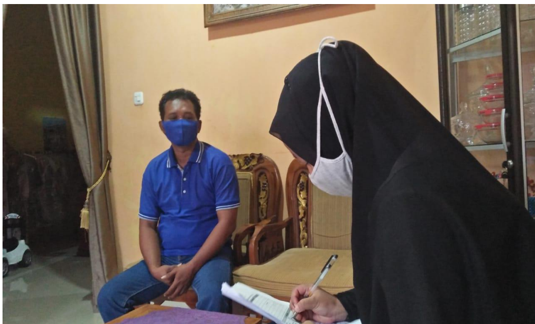
Gambar 3 Kegiatan survei lapangan