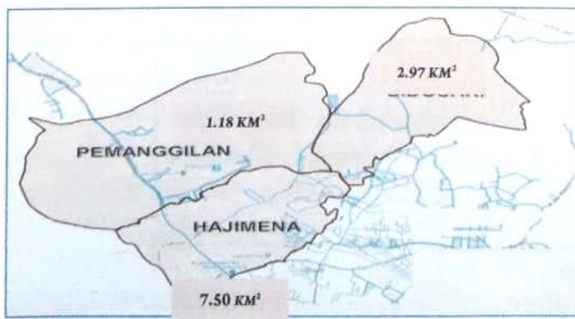
Gambar 1. Peta Wilayah Kerja Puskesmas Hajimena

Dari hasil survei didapatkan ada 2 indikator dengan cakupan rendah yaitu anggota keluarga tidak ada yang merokok dan anggota keluarga sudah menjadi anggota JKN.