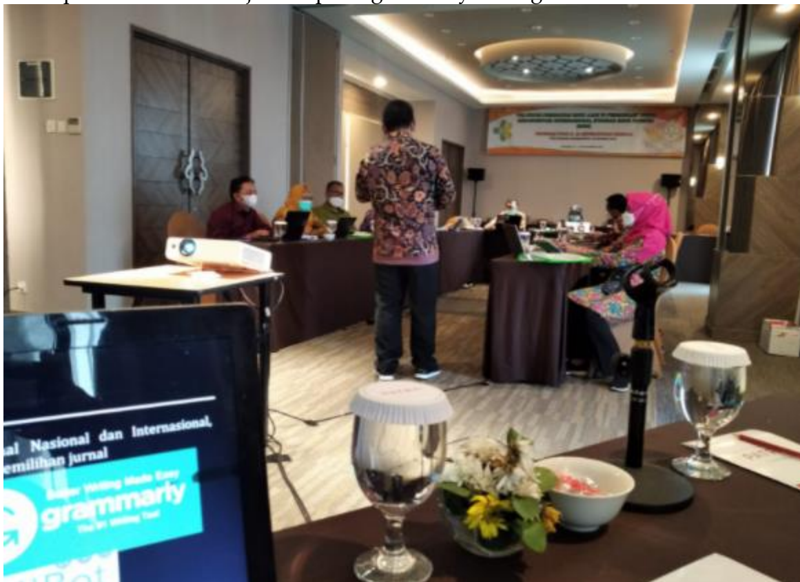
Gambar 3 Foto Praktik Pelatihan

Materi dasar pengeditan merupakan materi setelah peserta memahami dengan baik konsep buku ajar yang dapat dikembangkan oleh dosen di perguruan tinggi. Materi ini terdiri dari bagaimana konsep pengeditan mulai dari layout melakukan parafrase sampai dengan membuat style di dalam word. Hari kedua merupakan praktik pembuatan buku ajar tampilan gambarnya sebagai berikut: