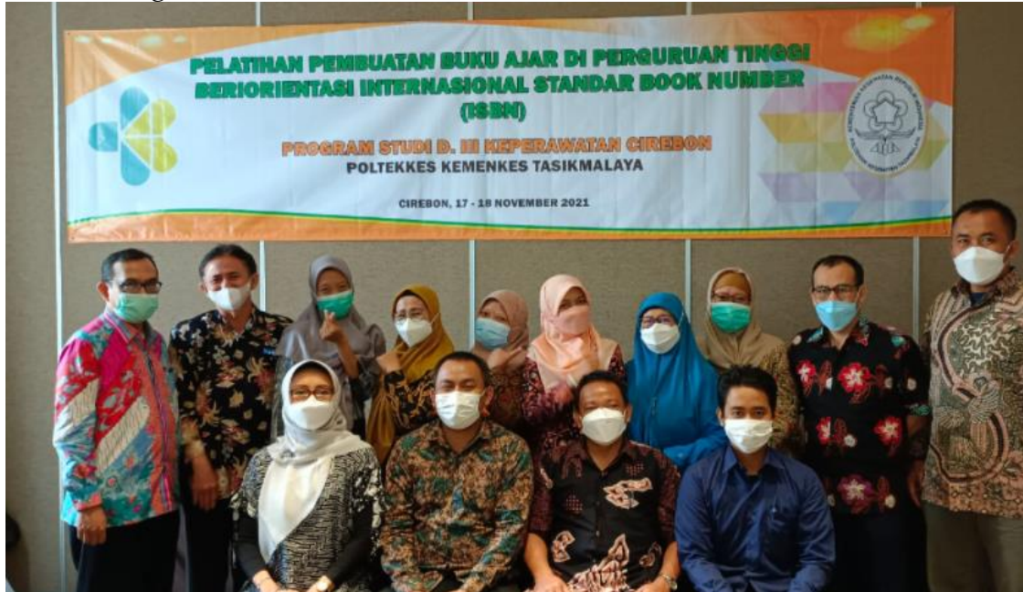
Gambar 4 Penutupan Kegiatan Pelatihan

didampingi langsung oleh pendampingan. Pendampingan ini dimaksudkan agar semua peserta dapat membedah RPS yang sudah dimiliki sehingga mampu dibuat dalam bentuk setiap BAB dalam buku ajar yang disusun. Semua peserta antusias melaksanakan pelatihan dan memiliki pemahaman terkait proses pembuatan buku ajar. Draft layout semua peserta tersusun dengan baik sehingga semua peserta dapat meneruskan pembuatan buku ajar setelah beres kegiatan ini. Foto akhir pelaksanaan pelatihan sebagai berikut: