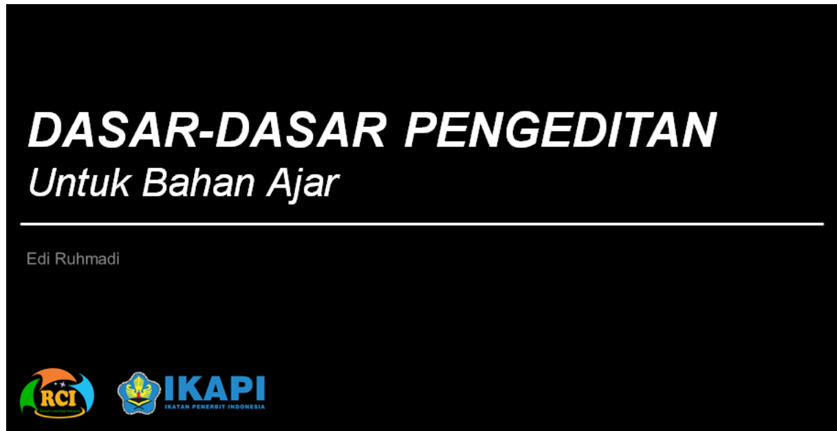
Gambar 2 Materi Dasar-dasar Pengeditan

Materi dasar pengeditan merupakan materi setelah peserta memahami dengan baik konsep buku ajar yang dapat dikembangkan oleh dosen di perguruan tinggi. Materi ini terdiri dari bagaimana konsep pengeditan mulai dari layout melakukan parafrase sampai dengan membuat style di dalam word. Hari kedua merupakan praktik pembuatan buku ajar tampilan gambarnya sebagai berikut: