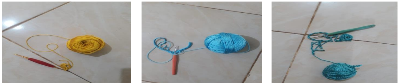
Gambar 2. Proses Awal Merajut

Sedangkan terkait dengan metode pelaksanaan program ini melalui empat tahap yakni :