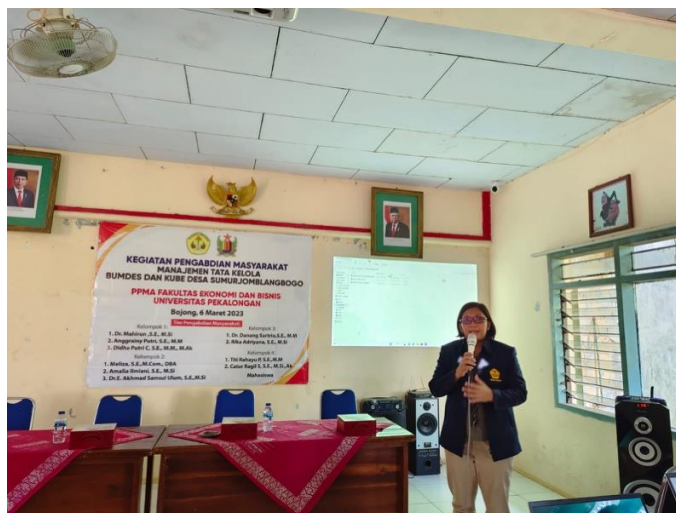
Gambar 5. Penyampaian Materi Manajemen Bisnis