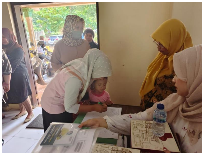
Gambar 2. Registrasi Peserta Kegiatan PkM

Peserta melakukan registrasi dengan mengisi daftar hadir dan mendapatkan fotocopy materi presentasi. Peserta hadir dengan tetap mematuhi protokol kesehatan (memakai masker dan mencuci tangan dengan handsanitizer ) sebelum masuk ke ruangan.