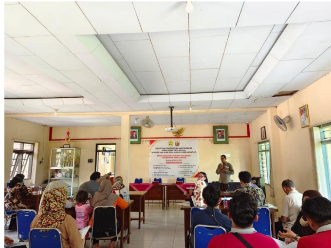
Gambar 7. Penyampaian Materi Kelembagaan