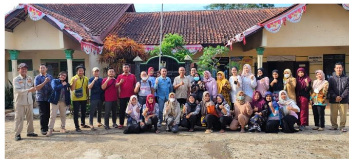
Gambar 8. Foto Bersama Mitra PkM

Setelah selesai kegiatan PkM ini, Tim Pengabdian Masyarakat FEB UNIKAL memberikan kuesioner kepada peserta pengabdian dengan tujuan untuk memberikan evaluasi atas kegiatan yang telah dilaksanakan.