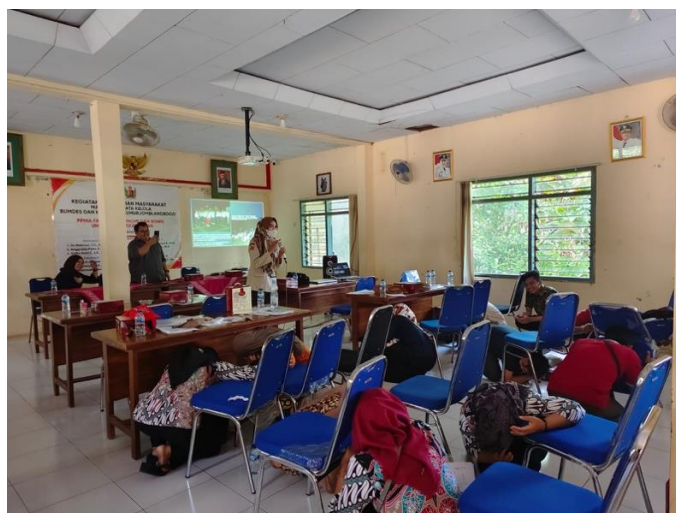
Gambar 6. Kegiatan Ice Breaking

Ice breaking diberikan diantara materi satu dengan materi yang lain. Tujuan pemberian ice breaker agar untuk memecahkan kebekuan kerana kelelahan dan agar peserta tidak merasa jenuh, serta pikiran fresh kembali dalam menerima materi.