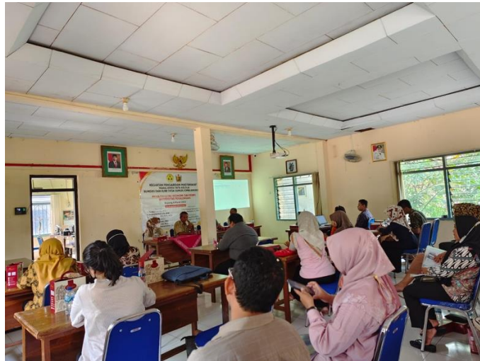
Gambar 3. Sambutan Kepala Desa Sumurjomblangbogo