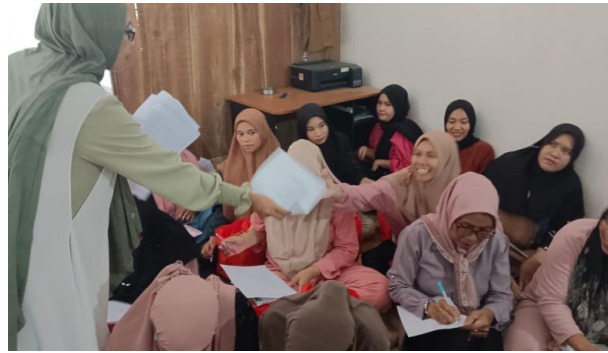
Gambar 5. Post test