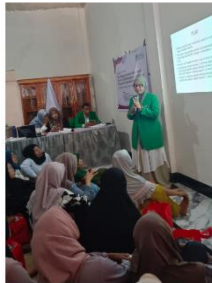
Gambar 7. Penyuluhan dan pelatihan pijat perineum

Penyuluhan kesehatan merupakan salah satu cara yang dilakukan untuk meningkatkan pengetahuan, sikap, dan perilaku masyarakat terhadap kesehatan. Faktor penting terkait penyuluhan kesehatan adalah proses komunikasi yang baik dan informasi yang tepat dan akurat sehingga masyarakat mampu mengidentifikasi, mencegah, dan mengatasi masalah kesehatan yang dihadapi. Berbagai topik yang bisa diangkat antara lain, cara mencegah penyakit, gaya hidup sehat dan tips menjaga kesehatan di usia lanjut. Melakukan penyuluhan kesehatan yang efektif, diharapkan masyarakat dapat lebih sadar akan pentingnya kesehatan, mengadopsi perilaku sehat, dan secara keseluruhan menjalani gaya hidup yang mendukung kesehatan mereka.