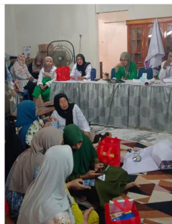
Gambar 3. Pembukaan penyuluhan dan pelatihan pijat perineum untuk mencegah perdarahan.