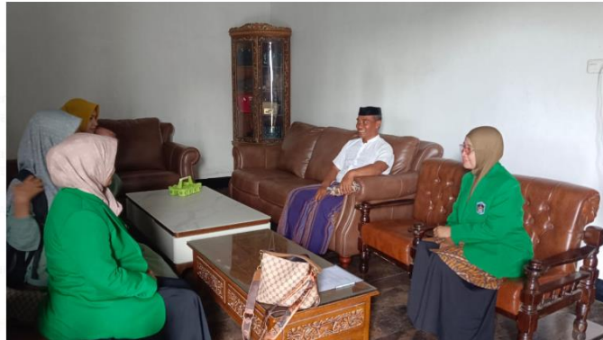
Gambar 1. Koordinasi ijin dengan kepala desa Tonasa untuk melakukan kegiatan pengabdian

perineum yang dilakukan secara rutin sejak usia kehamilan > 34 minggu efektif memperkecil risiko ruptur perineum, terutama pada ibu primipara karena otot-otot perineum dan vagina menjadi lebih elastis dan kuat. Diperlukan keterampilan pijat perineum agar diperoleh manfaat yang optimal.