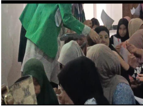
Gambar 4. Pre test