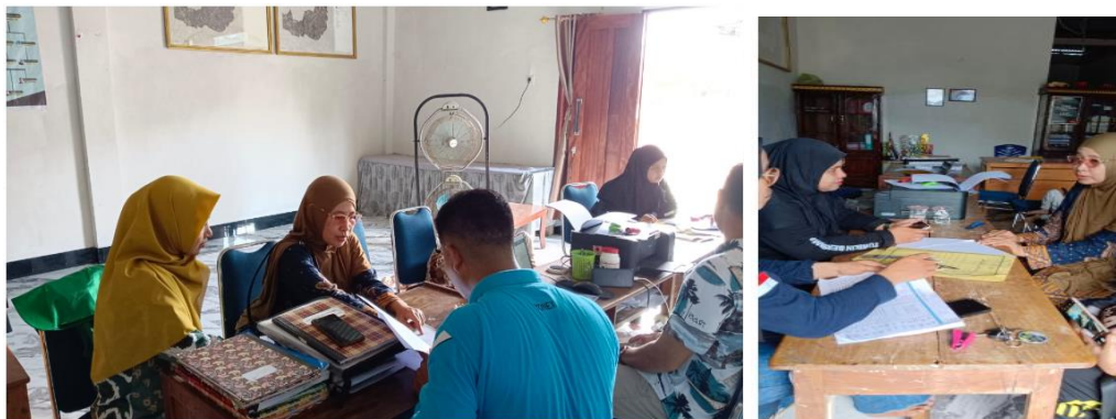
Gambar 2. Koordinasi dengan sekretaris desa dan seluruh aparat desa untuk melakukan kegiatan penelitian