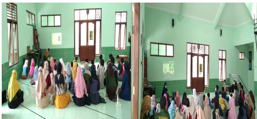
Gambar 2. Foto Sosialisasi Covid-19 dan Protokol Kesehatan

Sosialisasi ini dilaksanakan pada hari kamis, tanggal 01 April 2021 pukul 09.00 Wib sampai pukul 11. 00 Wib. Daftar hadir peserta dapat dilihat pada lampiran. Berikut ini foto kegiatan sosialisasi.