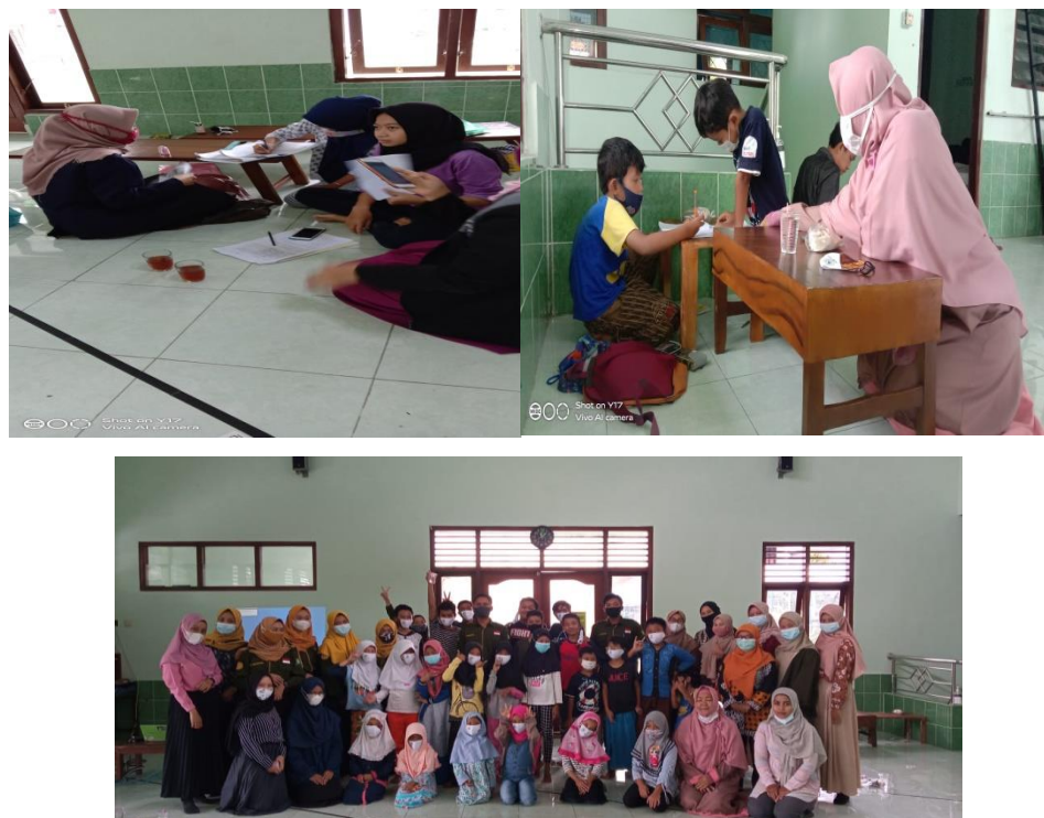
Gambar 3. Foto Kegiatan Pendampingan Pembelajaran